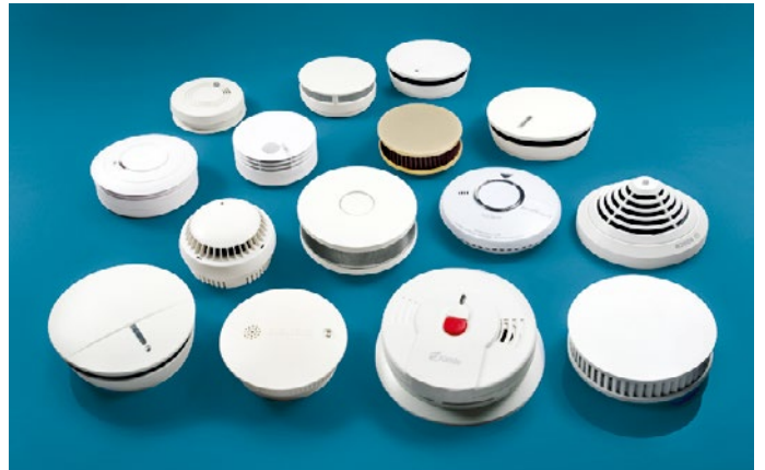
Abb.: Auswahl Rauchwarnmelder verschiedener Hersteller

Die Notstrom-Option gewährleistet eine einwandfreie Funktionsbereitschaft auch bei Stromausfall. Qualitativ hochwertige Melder arbeiten weitestgehend wartungsfrei.